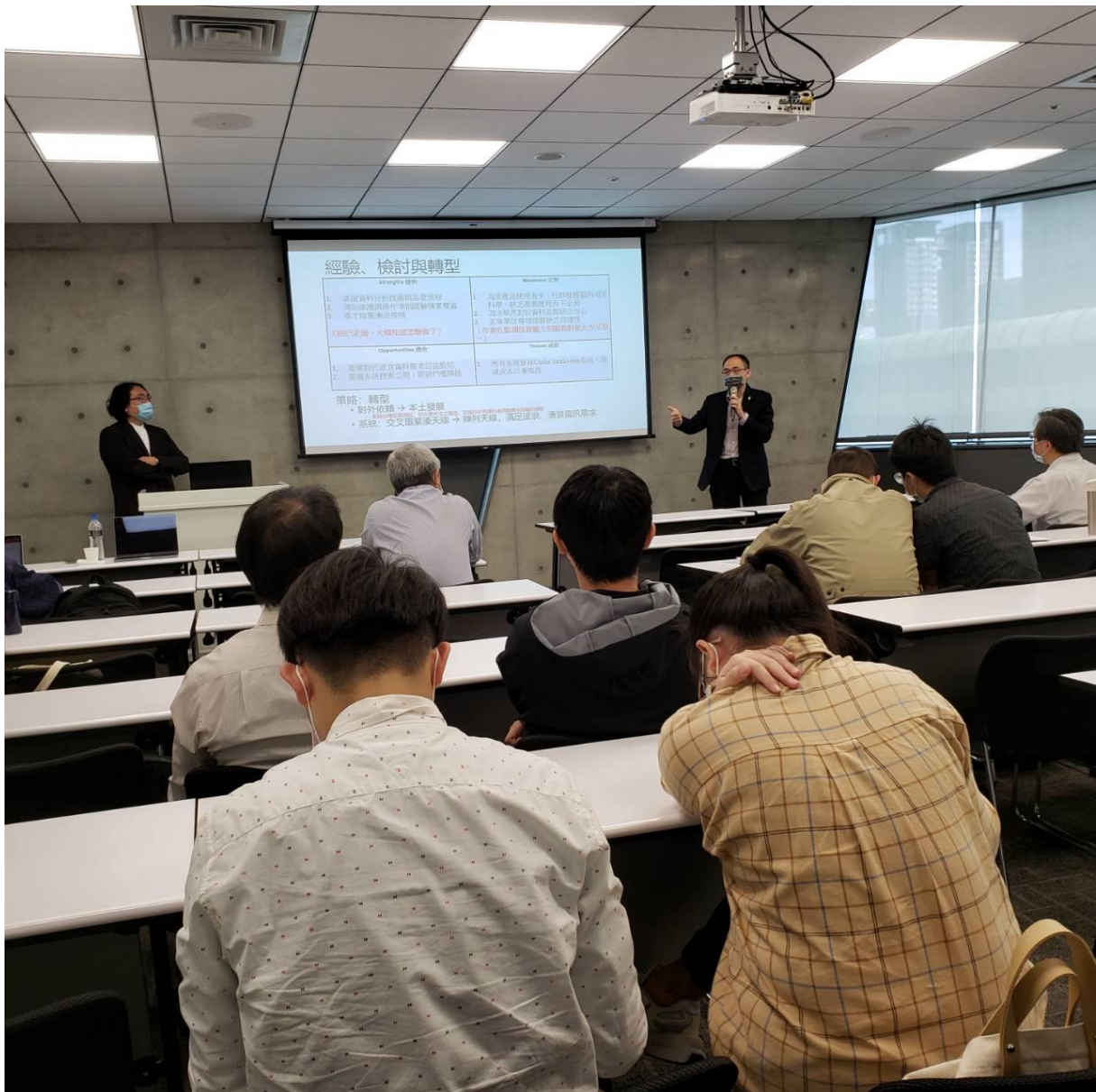
圖3：雷達遙測應用於商港海象觀測成果說明會活動剪影